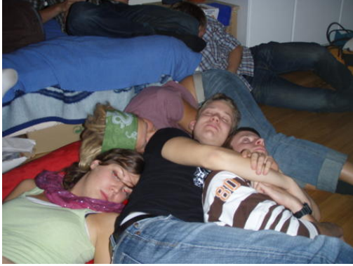
Så här kan en KOT-fest sluta...

och det andra. Pober drack mest av det andra och var därför inte helt sugen på sin halva grillade kyckling, dock var han väldigt mån om att alltid återställa vätskebalansen och helst öka den lite hela tiden... Att festen höll på långt in på morgonen kanske inte förvånar någon som varit på en KOT-fest och efterfesten blev hemma hos Vb himself. Där somnade många och några andra fortsatte festa och ha sig.