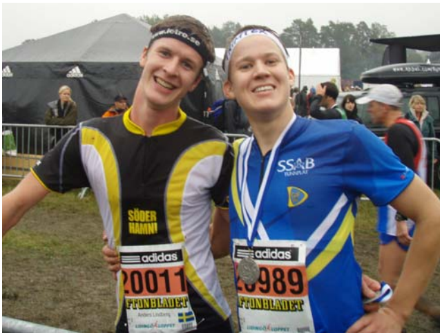
Lansen och Dala poserade glatt efter målgång.

Den fruktade Abborrbacken närmade sig med stormsteg. Lansen hade under förra året hittat en fin parkeringsplats i motlutet och hade säkert större respekt för kilometer nummer 25 än jag. Backen kunde dock passeras med snabba, om än korta, steg i ett hyfsat tempo och den långsammaste kilometern på hela