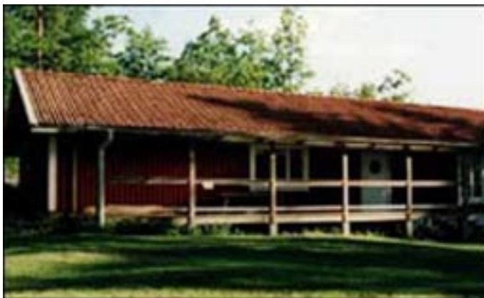
Hellas klubbstuga Granby, som den såg ut innan KOT hade haft vårläger.