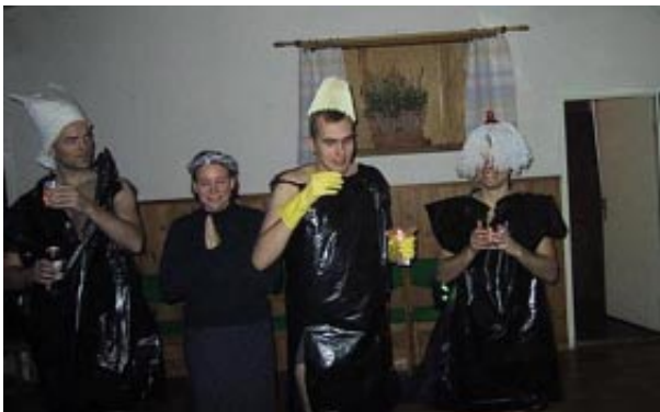
Rubens bild av ett traditionellt svenskt luciatåg...