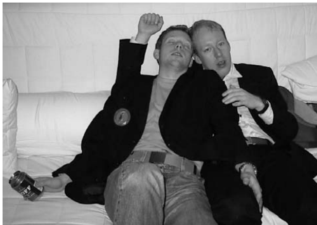
Singel är en livstil.