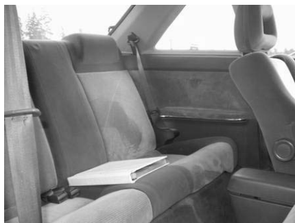
Baksätet i Mazdan är väldigt trevligt trots sin instängdhet.

I ronden komfort blev det hårt mellan två av testbilarna. Saab har förutom säkerhet även kända för att alltid gjort sköna stolar. När man sätter sig i baksätet på de nydammsugade plyschsätena är det precis som att sätta sig i en hästens säng, det är en välkomnande känsla som sprider sig i kroppen och gör att man bara vill sitta kvar, tills man upptäcker att den saknar nackstöd. När man så just lämnat den välstädade Saaben och kliver in i Toyotan så är det med en mindre chock, för ordet städa har nog aldrig uttalats sig innanför karossen på VB:s bil. Och jämföra sätena är bara skamfullt för Saaben, nä, åker man i det här sätet så kommer passagerarna fråga hur långt det är kvar innan bilen ens börjar rulla. Det är med vissa hinder man tar sig in i baksätet på Mazdan, det här är ingen bil man rånar banker med. När man väl sitter där så är det väldigt trivsamt, men lite instängt. Framsätet är exemplariskt, de skålade stolarna ger en sportig känsla tillsammans med elhissarna och den el-styrda takluckan, ända tills man passerar 110 km/h (olagligt!) då hela farkosten börjar vibrera på grund av obalans.