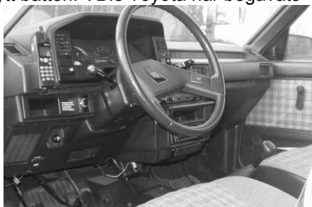
Toyotan har en väldigt praktisk mobiltelefonhållare.

Det var ganska svårt att hitta utrustning i bilarna. Ingen av bilarna hade GPS eller färddator vilket är ett stort minus. Saaben kan skryta med läsbelysning och makeupspegel, och de ack så viktiga extraljusen i fronten, som dessutom nu matas med ström från ett sprillans nytt batteri. VB:s Toyota har begåvats med en modern CD-spelare som jag tyvärr missade att prova, men vi får hoppas att den fungerar, för övrigt är bilen utrustad med motorvärmare (viktigt på sommaren!) och en mobiltelefonhållare. Mycket av