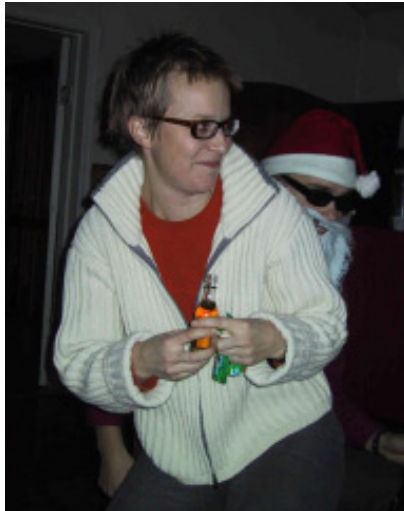
Oj, tomten har ett hårt paket!

Lussefest med Kot vad är det?! Med den senaste och enda festen med kotare i diffust minne var inte den stora frågan -vad? utan -hur mår jag dagen efter?