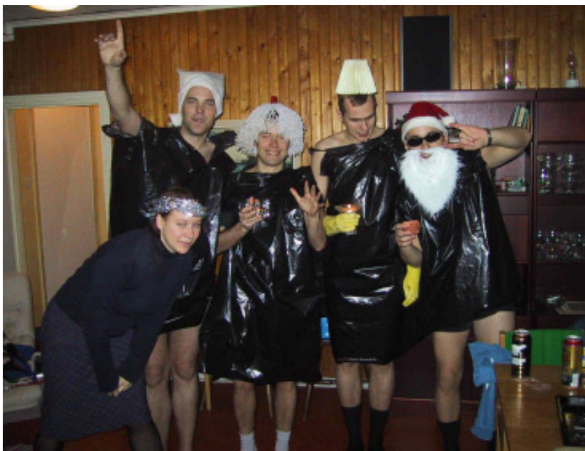
Styrelsen förbereder sig inför lussetåget

Efter lång stund i bastun var det dags och leta sig ner till gala hallen där resten av festen skulle hållas. Välkomst glögg och bordsplacering senare var middagen igång med tomte besök och allt. Och kan ni tänka er han hade snaps till julbordet med sig hur kunde han veta att detta passade så bra och det räckte precis till alla också, även Magnus som var iväg och köpte tidningen, jäkla tillfälle att gå och köpa tidningen på.