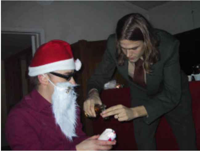
Tomten är törstig och hungrig

Väl framme vid Lappis var jag nästan sist som vanligt. Ett snabbt ombyte och jag och alla andra klara för start. (Det var många jag inte kände igen.) Nästa stora beslut var kort eller lång bana, svårt val men med tanke på lampa och tidigare förkylning blev det den korta. Ett mycket klokt beslut visade det sig.