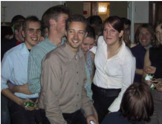
Alla i tomtens knä

Väl framme vid Lappis var jag nästan sist som vanligt. Ett snabbt ombyte och jag och alla andra klara för start. (Det var många jag inte kände igen.) Nästa stora beslut var kort eller lång bana, svårt val men med tanke på lampa och tidigare förkylning blev det den korta. Ett mycket klokt beslut visade det sig.