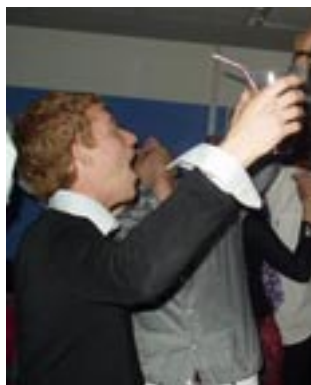
Nokia är uppsluppen

Så har då Kongliga Orienteringsteknologernas IF fått sitt 20-årskalas. KOT firades lördagen den 16:e November i Thérummet på Lantmäterisektionen, KTH. Meningen var att vi skulle ha haft festen i Kårens lokaler men eftersom det inte blev ett så stort antal anmälda som vi räknat med beslöt vi i jubileumskommittén oss för att ha middagen i Thérummet.