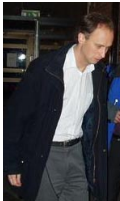
Artikelförfattaren på språng